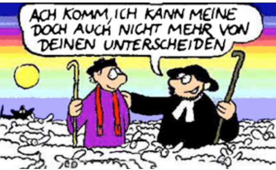
Trotz anders lautender Behauptungen fressen alle Schafe dasselbe Gras

seine Jünger machten sich unterwegs daran, Ähren abzurupfen. Da sagten die Pharisäer zu ihm: „Schau, was sie am Sabbat Unerlaubtes tun!“ Er antwortete ihnen: „Habt ihr noch nie gelesen, was David tat, als er Not litt und ihn und seine Gefährten hungerte? Wie er in das Haus Gottes ging, zur Zeit des Hohenpriesters Abjatar, und die Schaubrote aß, die außer den Priestern niemand essen darf, und auch seinen Gefährten davon gab?“ Und er sprach zu ihnen: „Der Sabbat ist um des Menschen willen da und nicht der Mensch um des Sabbats willen. Darum ist der Menschensohn Herr auch über den Sabbat.“