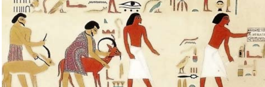
Semitische Abordnung stellt einen schriftlichen Antrag um Aufenthaltserlaubnis